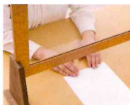
パネルの下から書類の受け渡しができます。